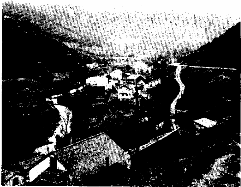
Laciana dispondrá en 1985 de 30 millones menos que el año pasado para inversiones y obras.

Los impuestos directos establecidos supondrán en 1985 para el Ayuntamiento de Villablino unos ingresos de 40 millo-